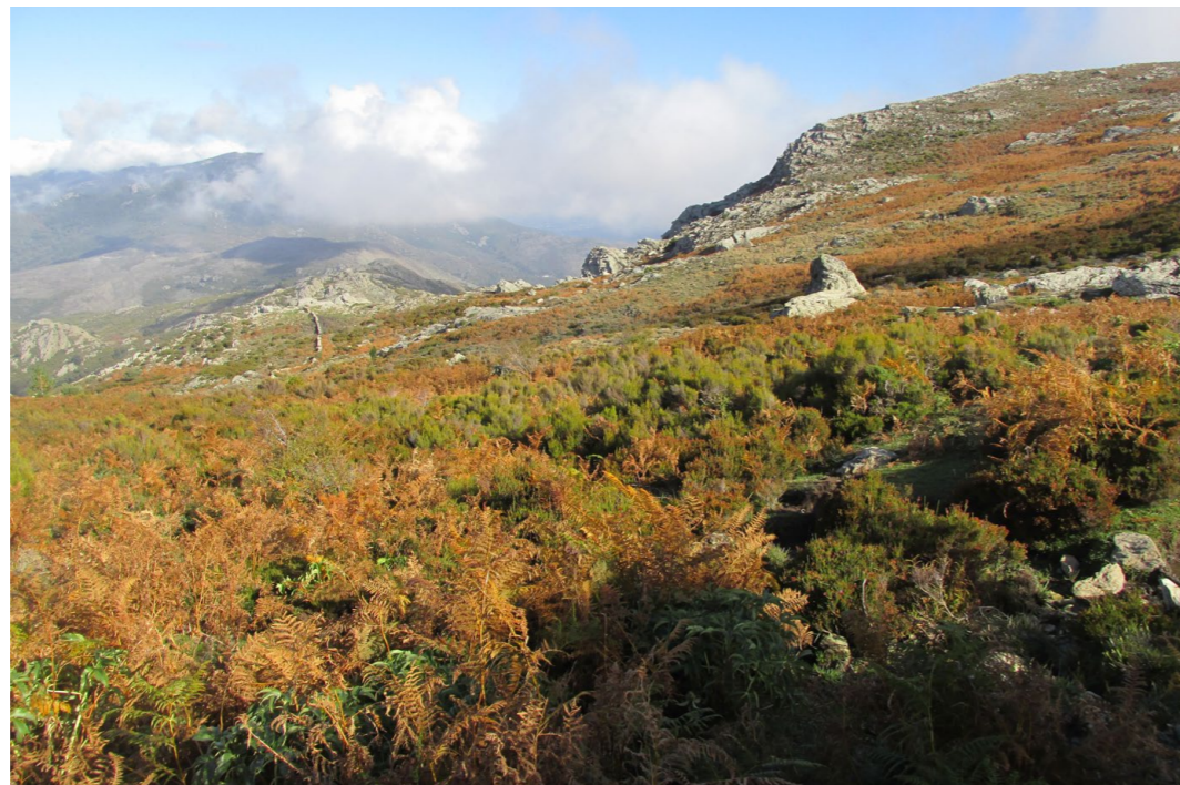
MASSIF DE TENDA