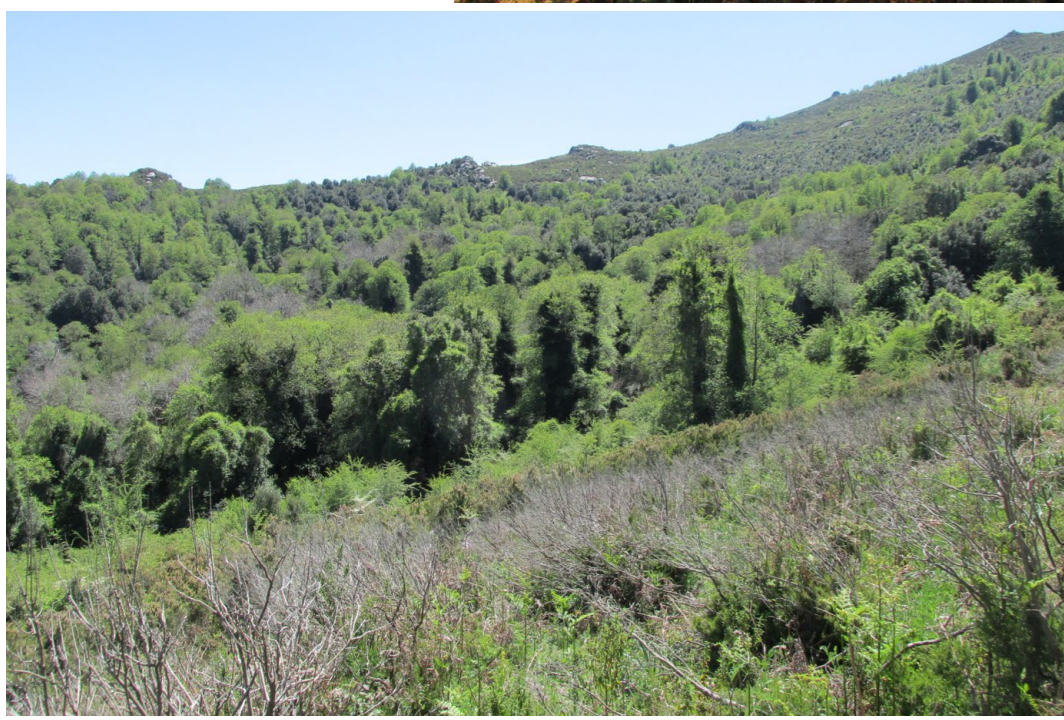
FORÊT DE STELLA