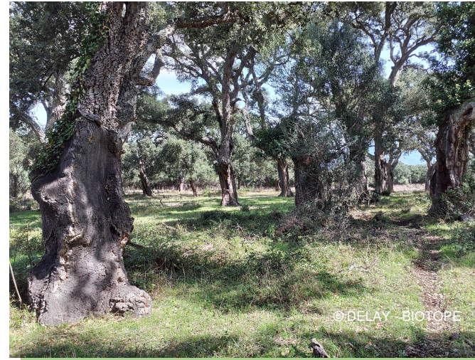
Suberaie du site