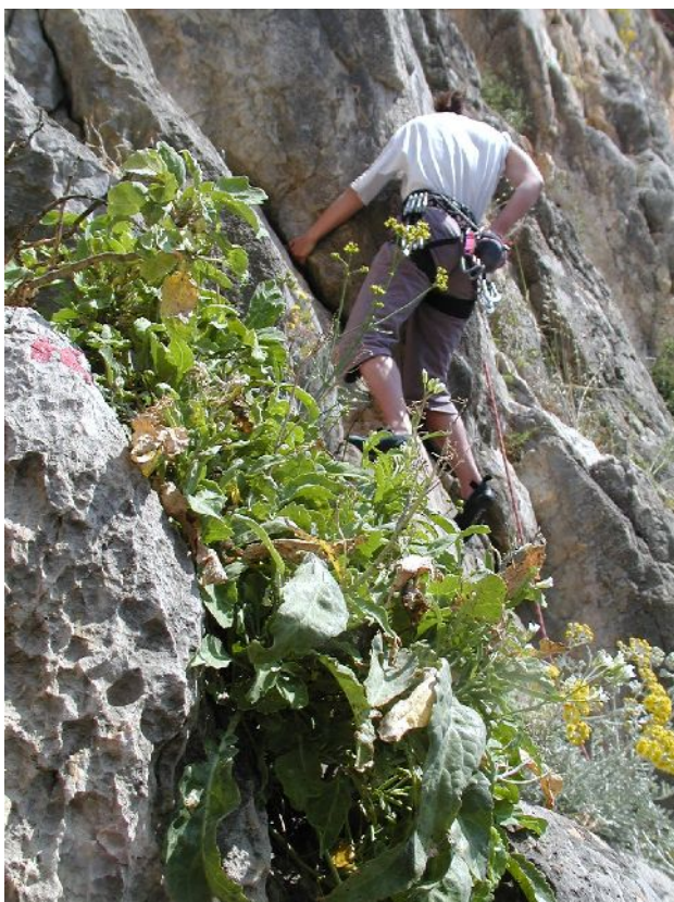
Suivi scientifique sur le site, relevés de terrain