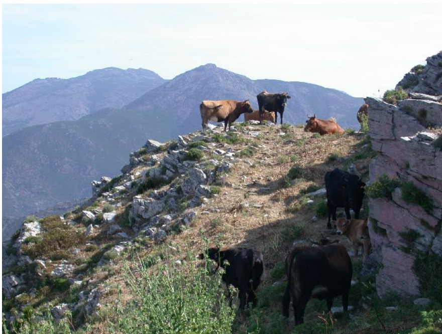
Troupeau de bovins sur le site à Brassica insularis de Barbaggio-Poggio d'Oletta

Actuellement sur le site de Barbaggio – Poggio d'Oletta, seuls le pâturage et le risque d'incendie constituent des menaces. L'impact du pâturage sur la population de Chou insulaire reste cependant à préciser. Par ailleurs, l'impact de l'utilisation éventuelle d'agents mouillants pulvérisés pour lutter contre les incendies serait également à préciser.