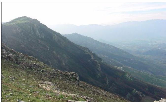
Feu de maquis - juillet 2003 - Monti Rossi