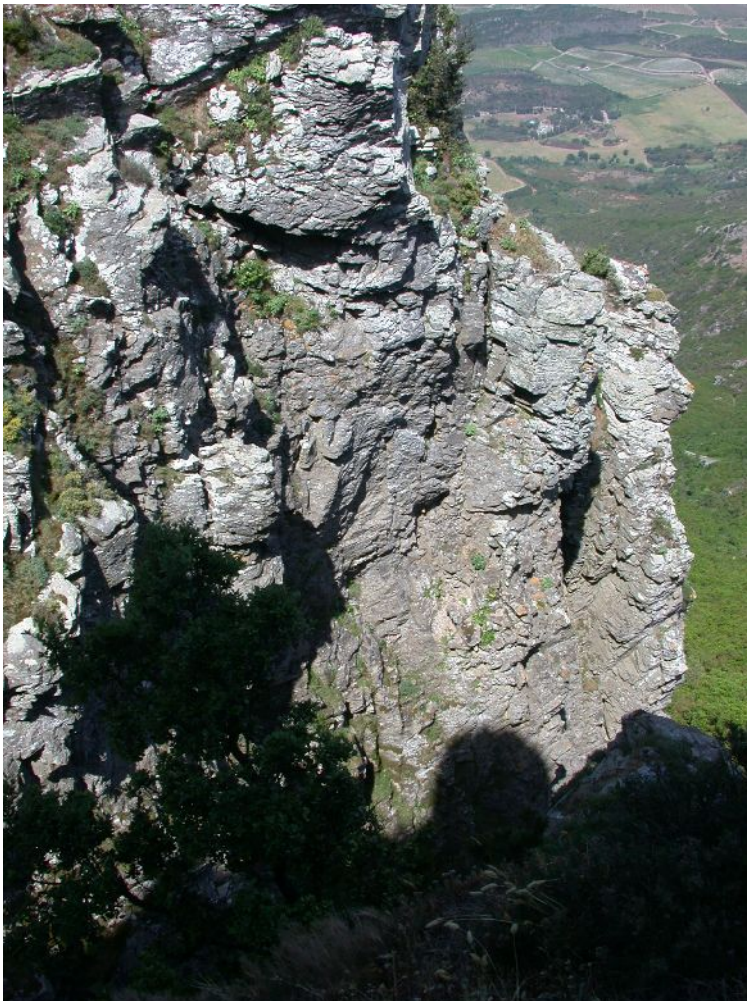
Pentes rocheuses calcaires avec végétation chasmophytique

En ce qui concerne le site de Barbaggio – Poggio d'Oletta, les principales menaces pesant sur la végétation des falaises calcaires sont le pâturage et le risque d'incendie. L'escalade ne se pratique pas sur le site. Par ailleurs, bien que situées à proximité de sentiers de randonnée, ou d'une piste fréquentée pour le parapente (Monte Secco), les falaises ne sont pas faciles d'accès. Une ancienne carrière en bordure de la départementale D38 abrite une population de Chou insulaire, mais cette carrière n'est plus exploitée.