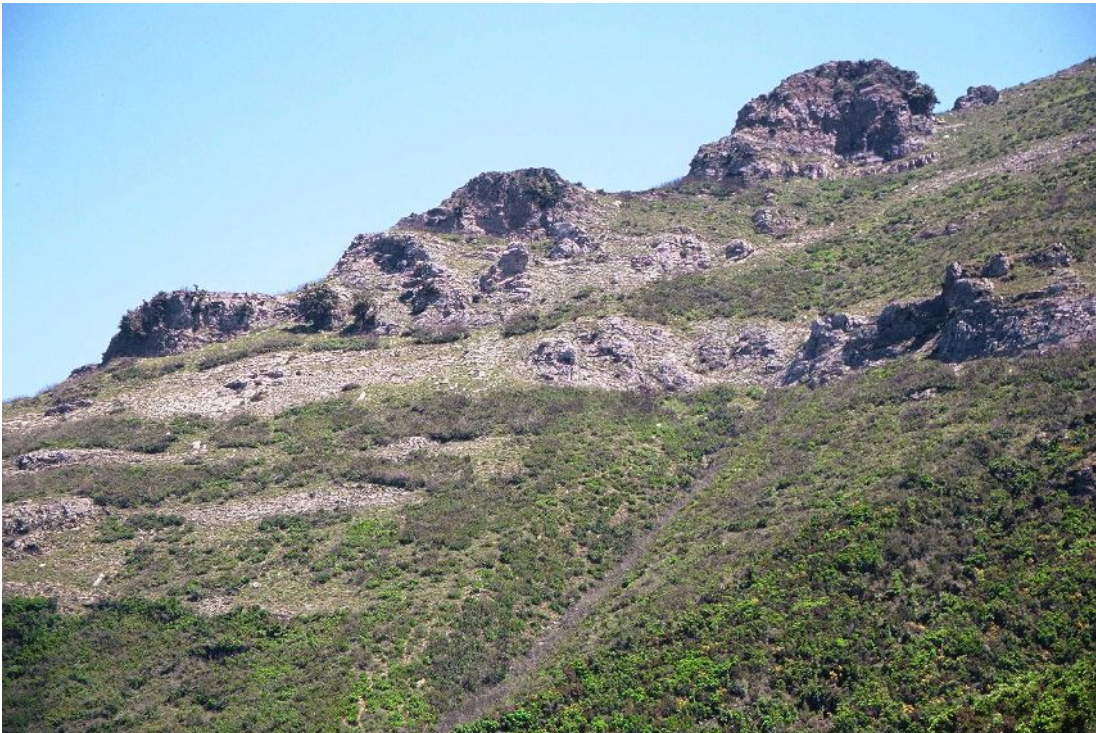
Pentes rocheuses calcaires avec végétation chasmophytique