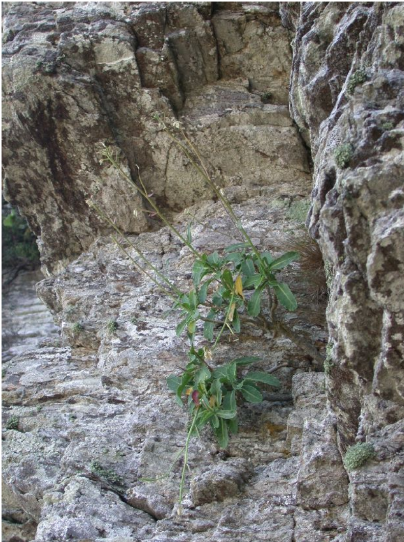
Brassica insularis