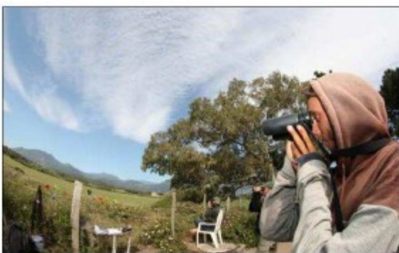
C'est parti pour la nouvelle saison de surveillance des oiseaux migrateurs.