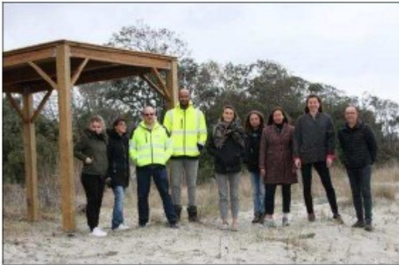
Visite du site des différents protagonistes.

Natura 2000 est un réseau écologique de sites naturels à travers toute l'Europe, identifiés pour la rareté ou la fragilité des espèces sauvages animales et végétales et de leurs habitats. Son objectif principal est de contribuer à préserver la biodiversité.